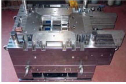
Outil en acier Uddeholm Nimax servant à la production de boîtiers d'interrupteurs électriques.

« Il nous fallait auparavant faire un choix entre la robustesse et la résistance aux chocs réduites de l'acier standard 1.2738/P20 et la médiocre usinabilité de l'acier extra dur 1.2738/P20. L'acier Uddeholm Nimax nous permet de proposer à nos clients un acier qui résiste bien aux chocs, tout en bénéficiant nous-mêmes de sa bonne usinabilité. »